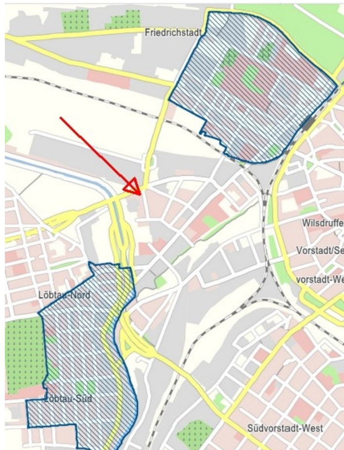
Lage des Viertels zwischen den Sanierungsgebieten